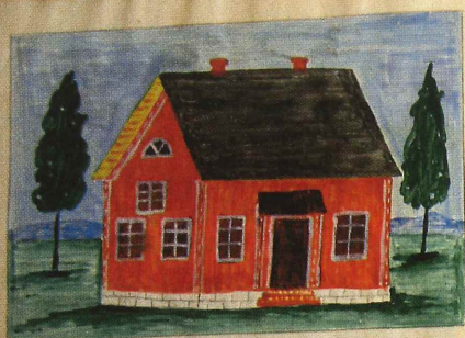
Tänkar, vid åsynen af ett Skolehus. (Att tillbringas om)